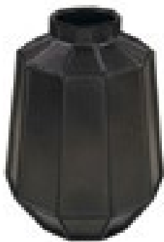
Facet vase ceramics medium black, 2005 © Piet HeinEek