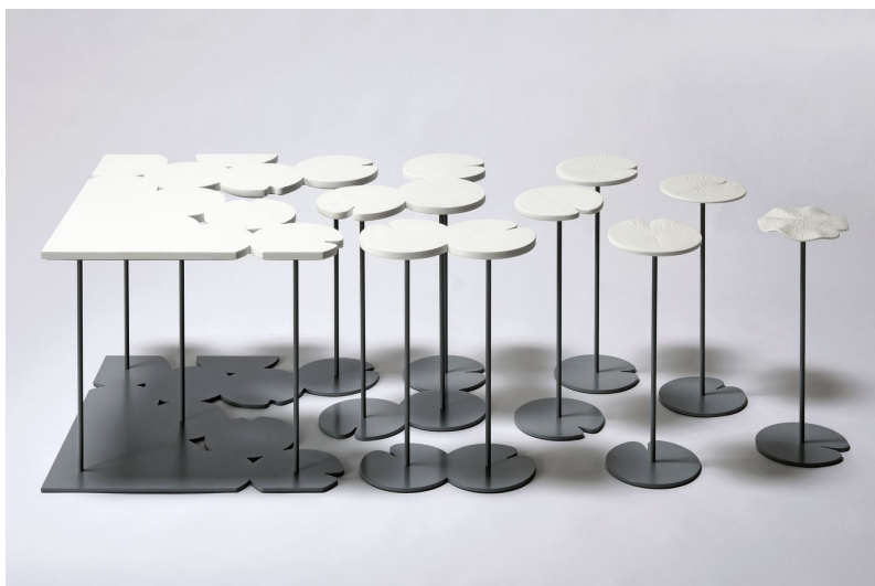
Table Hasu . nendo, 2018. Biscuit de porcelaine de Sèvres et laiton peint.

25 mai - 25 juillet 2018 Galerie de Sèvres, à Paris