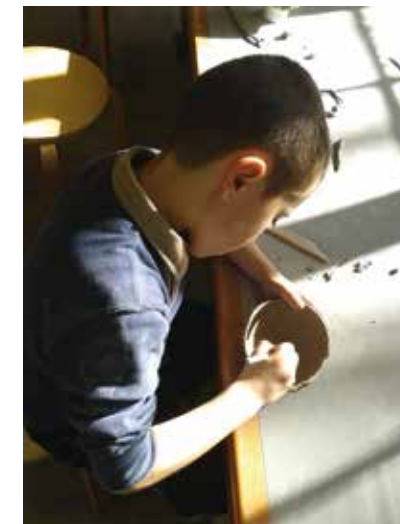
© Sèvres, Manufacture et Musée nationaux

avec le Mobilier national découverte de l'exposition et des tapisseries de Kari Dyrdal, démonstration de tissage et travaux pratiques jeudi 29 novembre jeudi 14 mars à partir de 8 ans durée 2h 150€